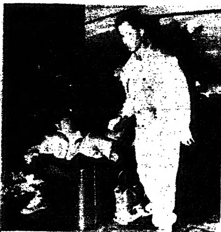
ماكرو في بيو المكتب ويجانبه الصور التي اصطلح به

لا تزال انباء ماكرو وستظل تطغى على غيرها من الاحداث. فلقد نشر ان جون ماكرو اصطلح بمصور وهو يسرع الخطى في قاعة استقبال الفندق. وعقد مؤتمرا صحفيا ادى فيه ببعض الاعترافات. وعرض خلال 45 دقيقة بصراحة وفي معظم الاحيان بكلمات عنيفة مشكلاته المتعلقة عن كونه نجما. واهداه والحياة السعيدة التي يعيشها مع تاتوم اونيل وقدمه لطريقته بصفه دافئة من جانب الصحفيين ورحبته في ان يصبح مرة اخرى لاعب التنس رقم 1 في العالم. وقد بدأت بطولة التنس الدولية في اوستراليا بالنسبة للاعب الاسريري. وقد اصطلح مليون غولف في الامتلح ولكن البطولة بدأت بتختم بسبب الشخصية الساحرة والمشاعفة للاعب غير عادي يريد السلام ولكنه يتردد في العودة الى التنس.